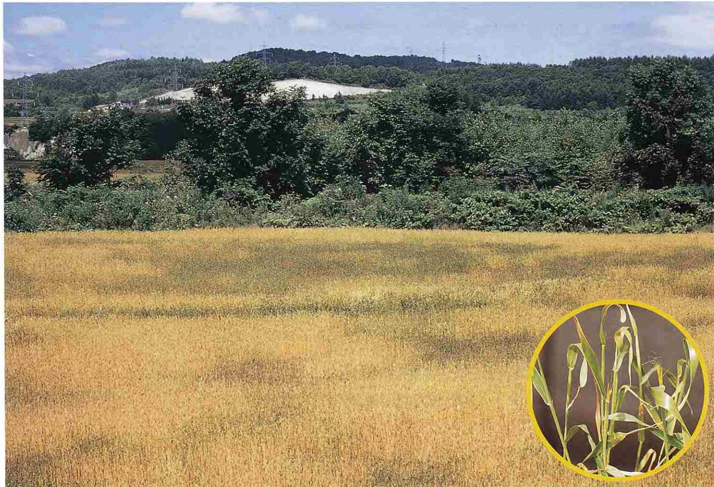
麦の銅欠乏(枯れあがり黒く、不稔が多い)